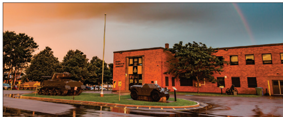
Le régiment de l'Î.-P.-É. aimerait augmenter ses effectifs. La photo de droite a été prise le jeudi 4 octobre au siège social du régiment.