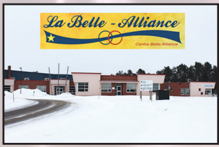
La Belle-Alliance (Summerside)