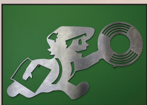
Kaneshii Vinyl Press (Charlottetown)