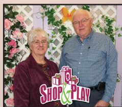
Shop & Play (Borden- Carleton)