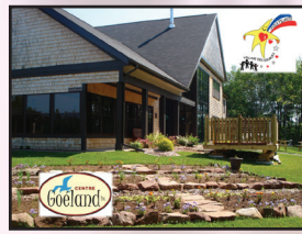
Centre Goéland/ Village des Sources