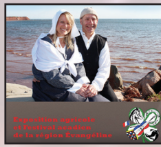
Exposition agricole et Festival acadien